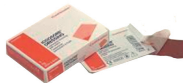
Lámina de cadexómero yodado

GC D 66569 Nombre Comercial IODOSORB DRESING